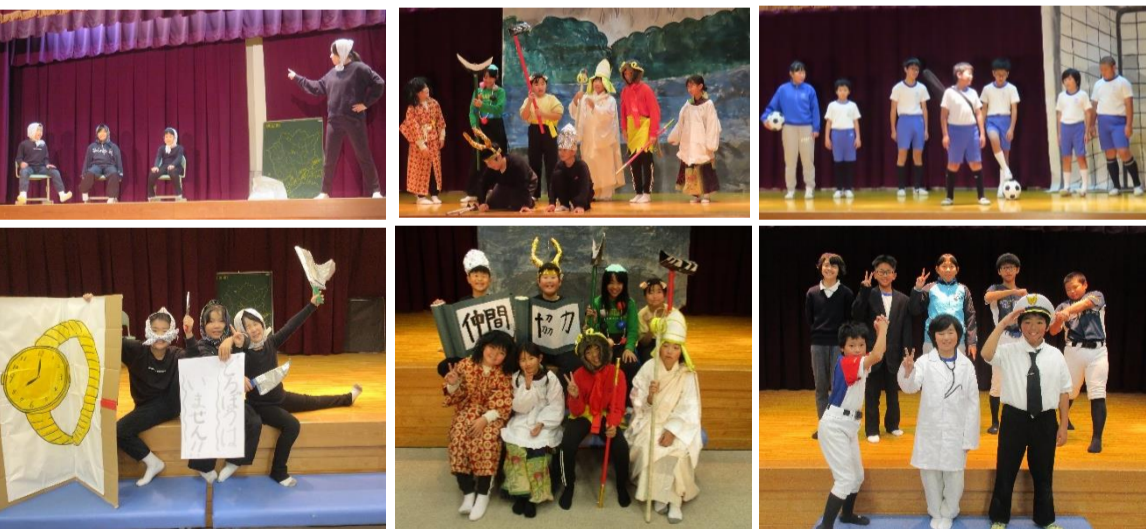
「どろぼう学校」(2年生) 「西遊記」(3・4年生) 「夢のバス: 8人の挑戦」(5・6年生)