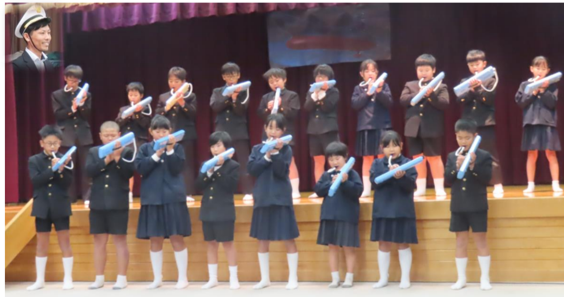
宇宙戦艦ヤマトの船長の指揮により、力強い音を奏でた鍵盤ハーモニカ奏(全校児童)

11月16日(日)の学芸会には多くの皆様にお越しいただき、ありがとう ございました。おかげさまで子どもたちは練習の成果を発揮し、音楽(斉唱・ 鍵盤ハモニカ奏)、銭太鼓、劇と張り切って発表することができました。