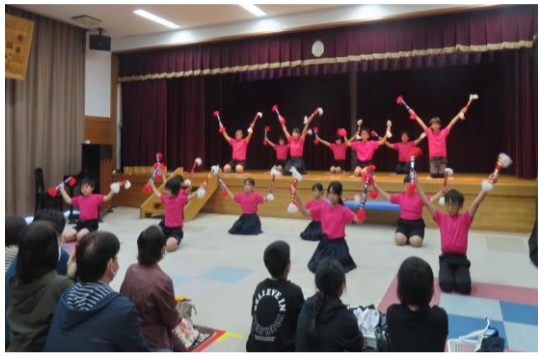
気持ちを一つにして発表した銭太鼓 (3～6年生) 「校歌」・「ピターバカンス」

これからもチャンス積極的に 掴み、楽しい学校生活を送って欲し いと思っています。