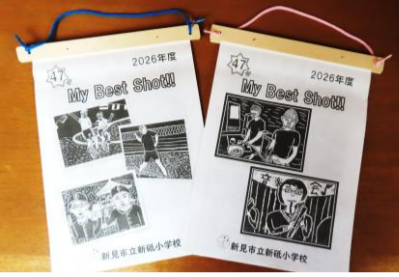
第47号版画カレンダー

新砥小学校は、来年度、 閉校を迎えますが、最後ま で本校のよさを大切に守 っていききたいと思ってい ます。引き続き、ご支援と ご協力をよろしくお願 いいたし ます。